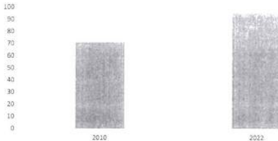
II. Оцена усклађености у области обезбеђивања и олакшица

Колико много су надлежни органи у области ваздушног саобраћаја урадили када је реч о усклађивању са релевантним европским и међународним прописима у овој области најбоље показује податак који је сам ИСАО констатовао у свом Финалном извештају припремљеном након посете Републици Србији у 2019. години и спроведене инспекције. У извештају се констатује да је проценат усаглашености Закона и подзаконских аката са међународним стандардима порастао са 73,33% на чак 93,33%. На сам текет Закона није било негативних коментара, али је сугерисана измена одређених интерних процедура, што је у међувремену и урађено. Ипак, стандарди се константно мењају посредством амандмана на анексе Чикашке конвенције, па се овај добар резултат може одржати само редовним праћењем тих стандарда и последичним изменама прописа.